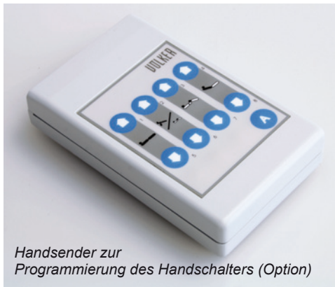
Handsender zur Programmierung des Handschalters (Option)