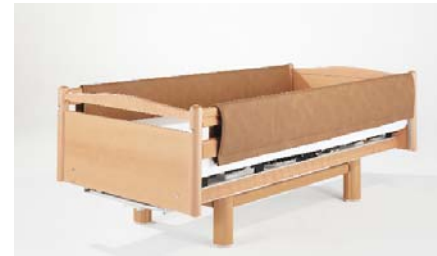
Seitengitterschutzbezug ZP-2056 E oder ZP-2056 EN, durchgehend, für Erhöhung Full-length protective pads for side rails with height extension / Housse de protection pour barrière latérale, d'un seul tenant, avec rehausse / Zijhek- beschermpjes doorlopend, verhoging