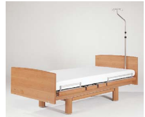
ISO-Normschiene ZK-1083/6 (40 cm)

IV pole / Tige porte-sérum / Infuusstandaard