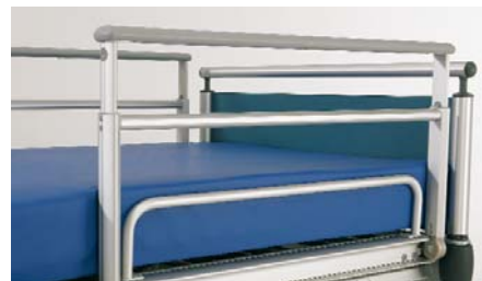
Seitengittererhöhung ZP-3074 / ZK-991 Side rail height extension / Rehausse de sécurité latérale / Zijhekverhoging