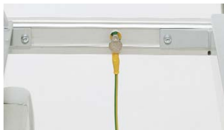
Potentialausgleichskabel ZP-948 (3 m) Voltage compensator cable / Câble d'équipotentialité / Potentiaalvereffe- ningskabel