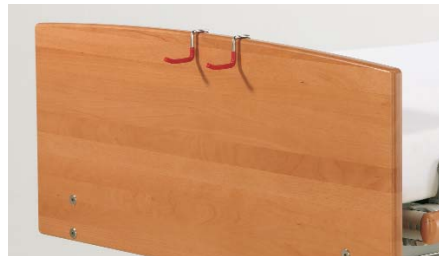
Fixiergurthalterung ZP-3051/3 (1 Paar)

Assist rail spacer holder / Support pour sécurité médiane / Ophanghaak beschermplaat