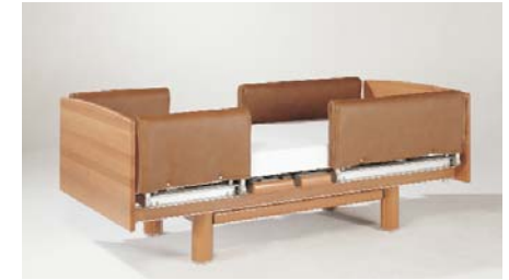
Seitengitterschutzhauben ZP-3056 CE / ZK-981 E, für Erhöhung Assist rail pads, 2 pieces with height extension / Housses de protection pour rehausse de sécurités médianes / Zijhek-beschermpjes als kap, verhoging (ohne Abb. / not illustrated / non illustré / zonder afbeelding)