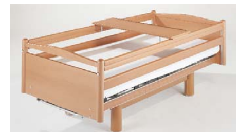
Schiebetablett ZP-2052 Sliding tray / Tablette coulissante / Eet-lesblad

→ Alle beschermhoezen zijn vervaardigd van een schuimlaag met een kunstlederen overtrek die bestand is tegen desinfecteermiddelen en worden als complete set voor een verpleegbed geleverd.