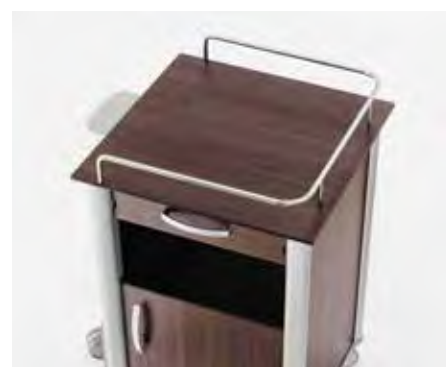
3-seitig umlaufende Reling