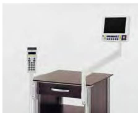
Vorrichtung für Telefonhalterung